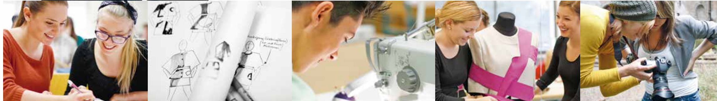
Vom Entwurf über das Modell bis zur Präsentation