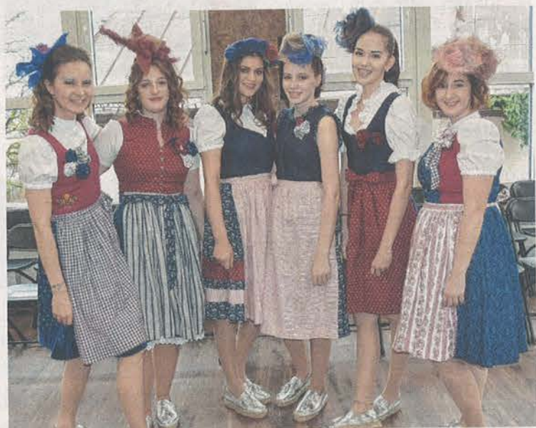
Großer Wert wurde bei der Show auf besonderes Hairstyling in Kombination mit neu interpretierter Tracht gelegt.

mit der Höheren Lehranstalt für Mode nicht nur die Schwerpunkte Modemarketing, Visual Merchandising, Modedesign und Grafik an, sondern auch Hairstyling, Visagistik und Maskenbildnerie. Weiters gibt es ein berufsbegleitendes Modekolleg mit dem Fokus auf nachhaltige