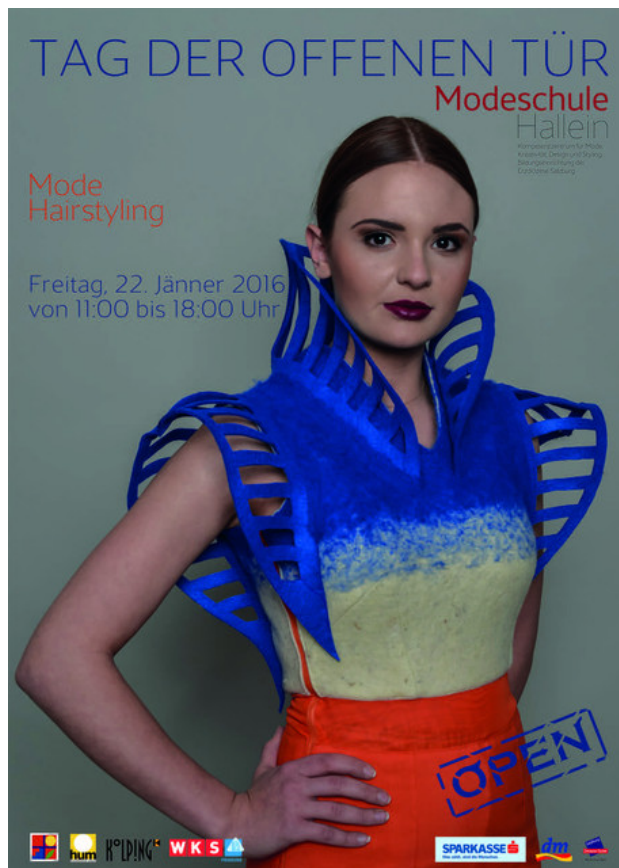
Tag der offenen Tür der Modeschule Hallein 2016