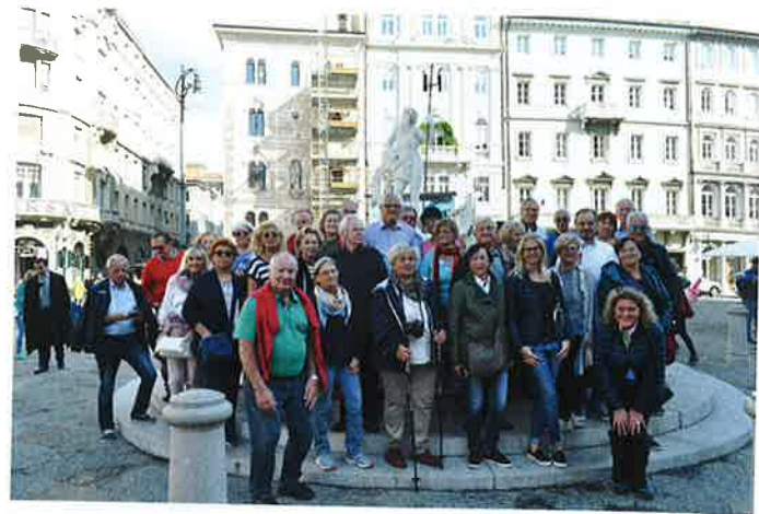
Foto: Teilnehmende der Bildungsreise